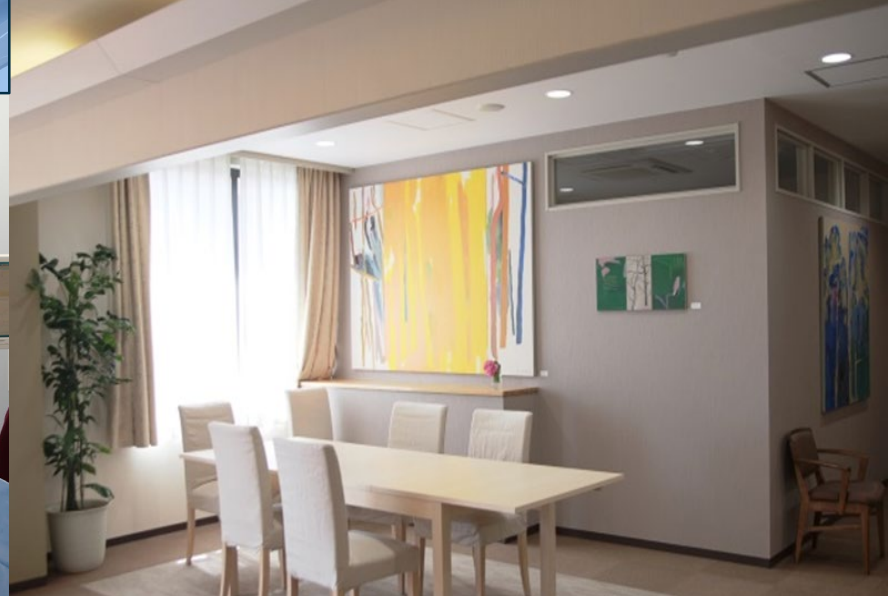
緩和ケア病棟 談話室