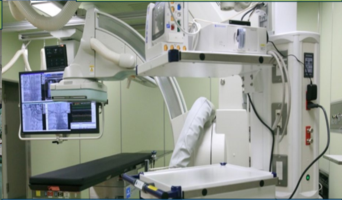
ハイブリッド手術室 (1室)