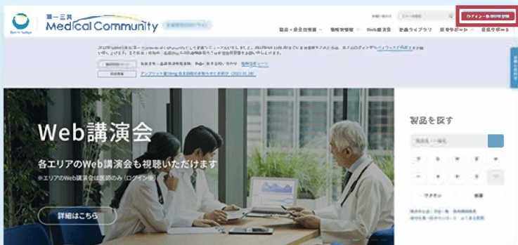
▲サイトのWeb講演会トップページ