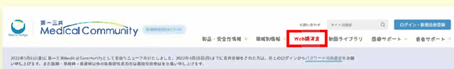
▲サイトナビゲーションエリア

登録したメールアドレス、パスワードでログインし、右上にある【Web講演会】をクリックしてください。